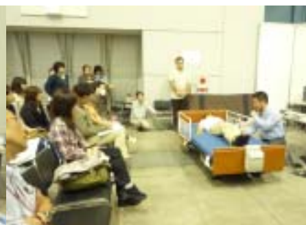
(株)タイカ 【ポジショニングクッションの使い方】