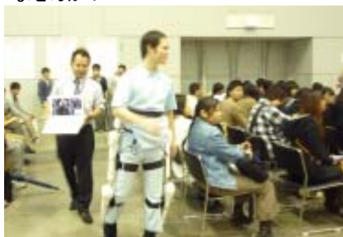
【ロボットスーツ HAL の紹介】