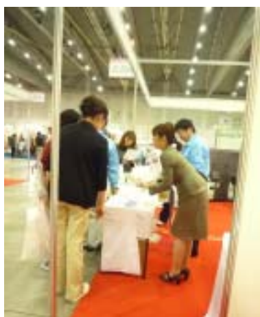
【ヒューマニー男性パッドの紹介】 ユニ・チャームヒューマンケア(株)

介護技術セミナー【起床から就寝までの一日の生活の流れの中 での介護技術を考える。】