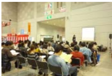
【摂食・嚥下障害のある方の介護技術】