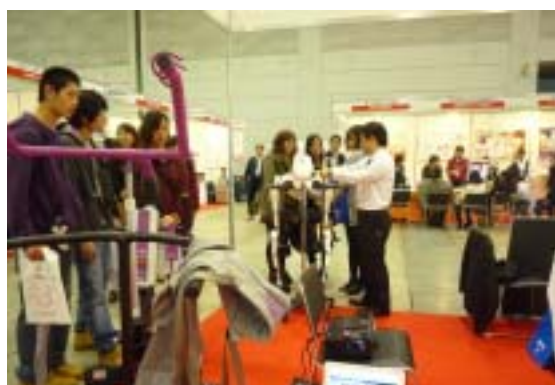
農協共済 別府リハビリテーションセンター