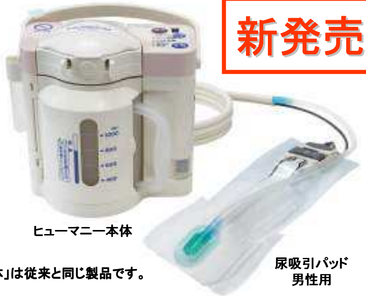
ヒューマニー本体

ヒューマニーの特長である 『朝までお肌を濡らさない』を 最大限に発揮する 男性専用の 吸引パッド が発売になりました。