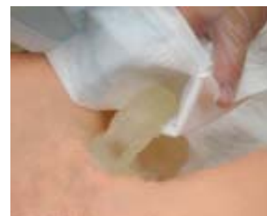
陰茎を挿入して装着

「チューブ差し込み口」と「センサー接続部」は従来のパッドと全く同じです。 (ヒューマニー本体は従来と同じ本体を使用します)