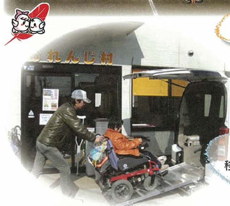
障がい者の 移動や就労の ために