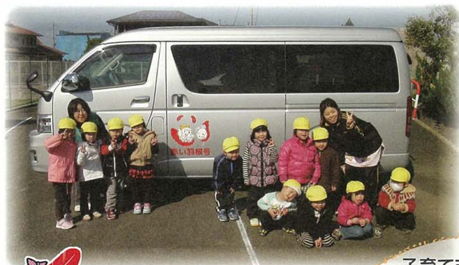
子育て支援の活動に