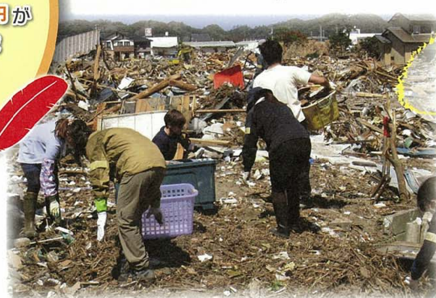
東日本大震災の 被災地での 支援活動に