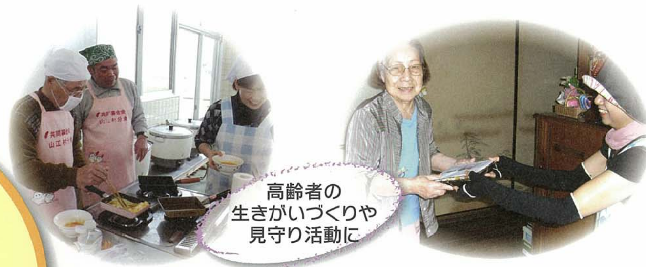
高齢者の 生きがいがづくりや 見守り活動に